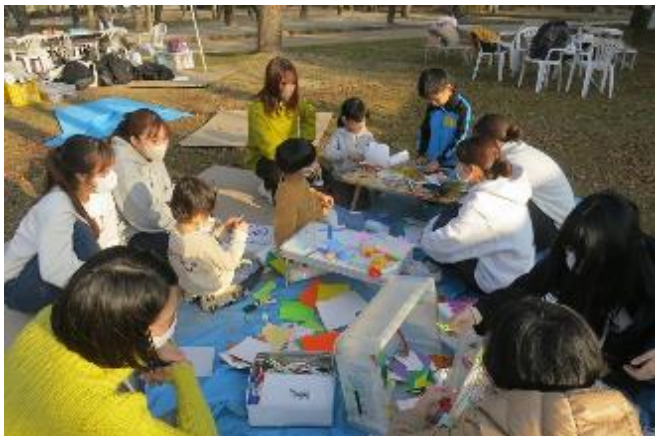
それにしても今日はボランティアの数が多い