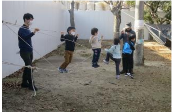
綱渡り 否 綱乗り・・・小鳥みたいに並んでる