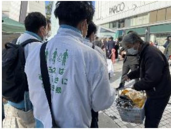
JT 広島支社のメンバー 掃除道具を提供