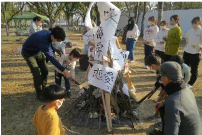
そして火付けの儀式