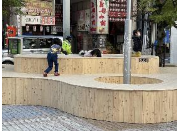
お好み村サイドのデッキ