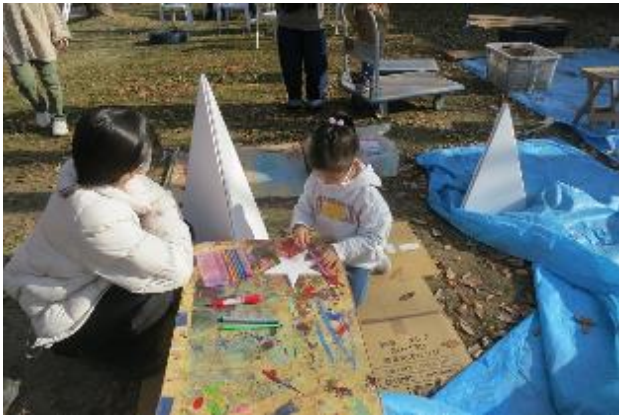
もうすぐクリスマス・・・ツリーづくり