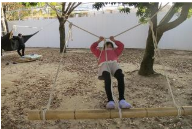
いつもとは違う位置に空中遊泳ブランコ・・・