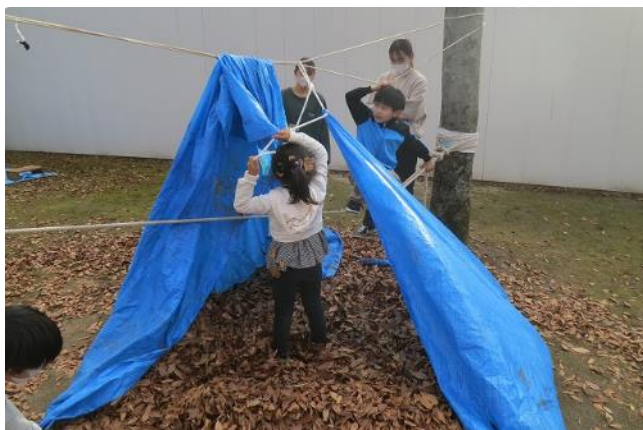
遊びの発展・・・シートを綱にくくりつけて