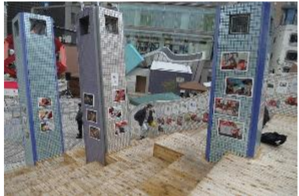
写真展示