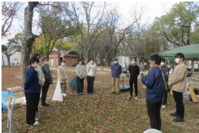
ボランティアの数が多く、男子も参加