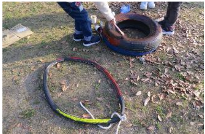
今回のアート大賞・・・しょうがないこれにするか！

【遊びの技法】《トンドの作り方》①まず後で燃えカスや灰で地面を傷めないように地面にトタンを置く ②長い竹を3本まとめて上部に針金（普通の紐ではすぐに燃えて崩れるので）を巻いて。下部を広げ、三又を立てる。これが基本構造体となる。③これに適度に木の棒や枝や細竹を渡して組んでトラス構造にする。針金で補強してもよい ④三又の下に細木を燃えやすいように組みその下に紙を入れる。その上に旧年のお札や、今年の正月飾りなど置く ⑤トラスの隙間に書初めなどを飾り付ける・・・⑥火付けの儀式・・・そして燃え上がる・・・（燃やすとき、書初めの紙などが飛ばないように注意する）・・・支柱の竹の上部の針金部分が燃えて外れると倒れる。⑦そのまましばらく地面で燃えている・・・竹に刺したお餅などを入れ焼いて食べる。いい感じに灰になるとき、焼き芋などする。