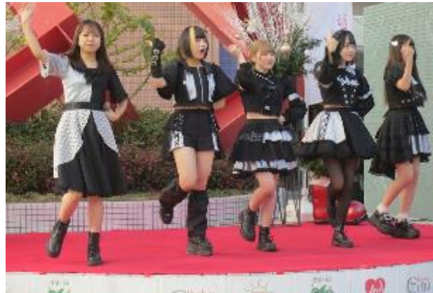
アイドルLIVE② BOKURANO SWITCH