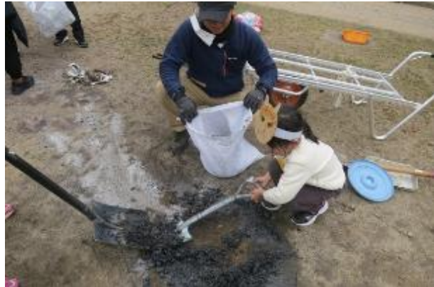
片付け時間・火の後始末を手伝う子