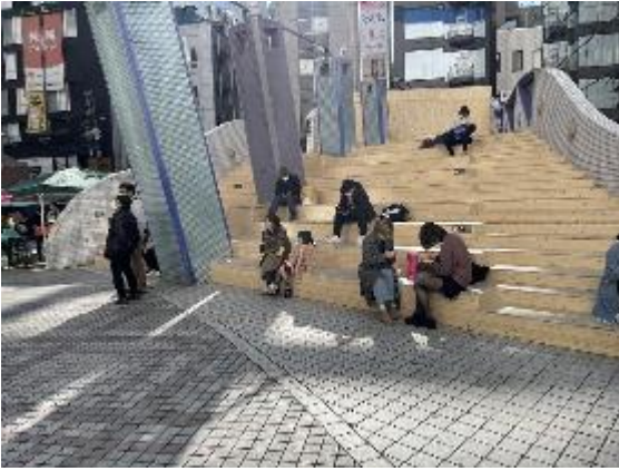
オープン後の階段