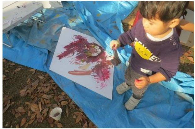
おっと抽象表現主義・・・アクションペインティング