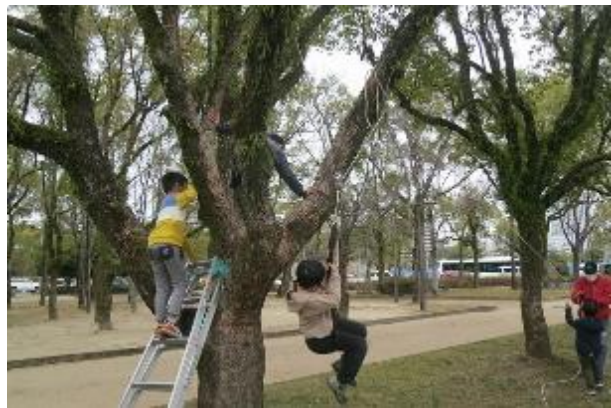
「鬼も内！」仲間に入れて、最後は仲良く記念撮影 いつもの光景だけど、木登りに適した樹の存在があってこそ