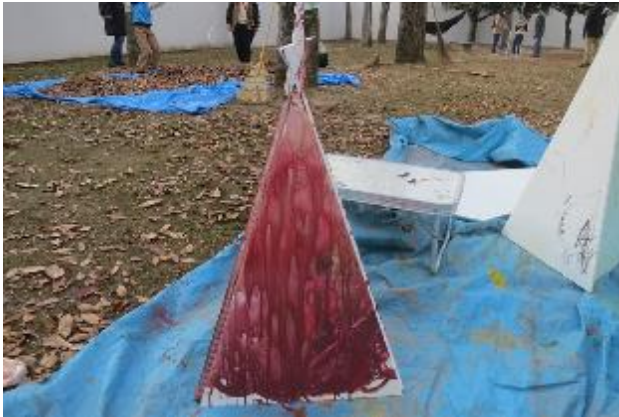
いい諧調の色が出た・・・