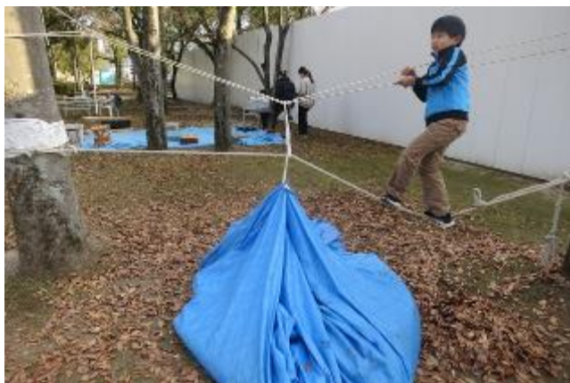
面白いオブジェになった。今回の「遊びの技法大賞」!