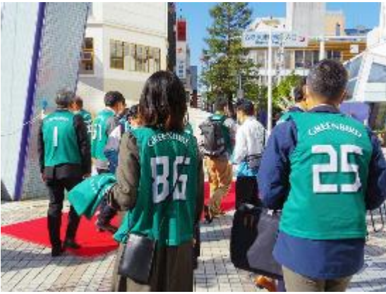
グリーンガードのメンバー