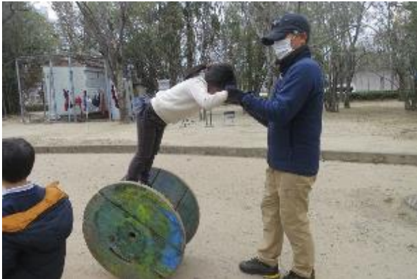
支えてもらって練習