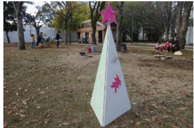
シンプルだけどどちらもいい、どちらも今回のアート大賞