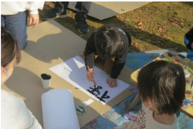
書初め 今年は何を願う

この日のメインは書初めと何ととってもみんなで作った小っちゃなトンド、でも意外と新春綱引きが受けた!