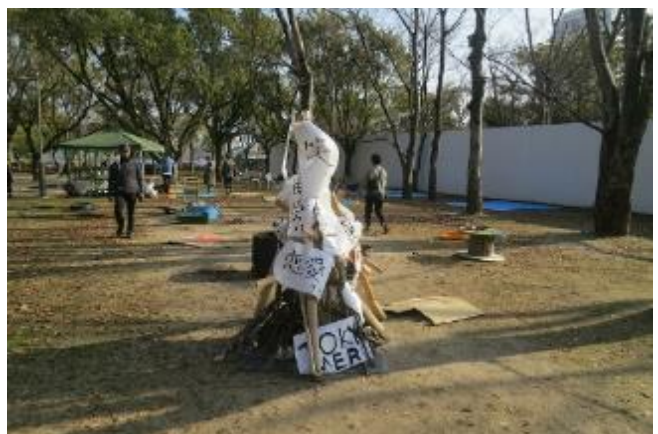
そしてトンドの完成