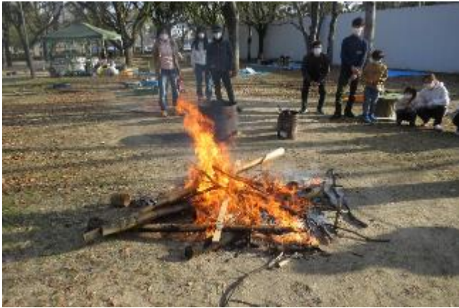
そして燃え尽きる