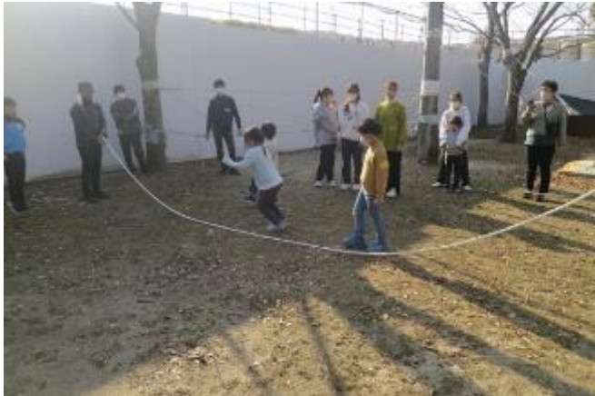
寒さなんて！こどもは体動かし外遊び