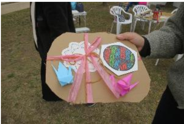
今回のアート大賞は2作品 こちらは平和のコラージュか？