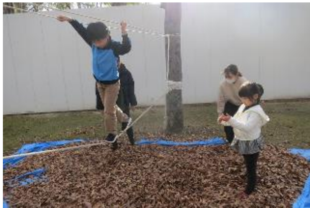
まだ落ち葉が残ってる、集めてプールに、その上に綱を渡して綱渡り・落ちて大丈夫