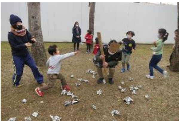
鬼もまいったと降参