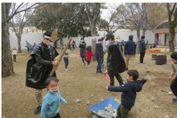
こどもたちの反撃