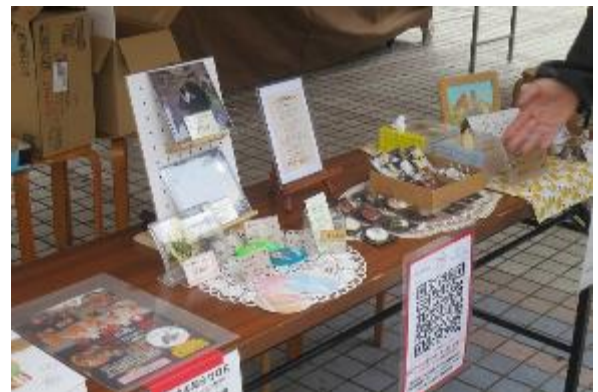
アーティスト物販コーナー