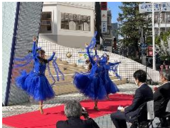
ダンスでセレブレーション