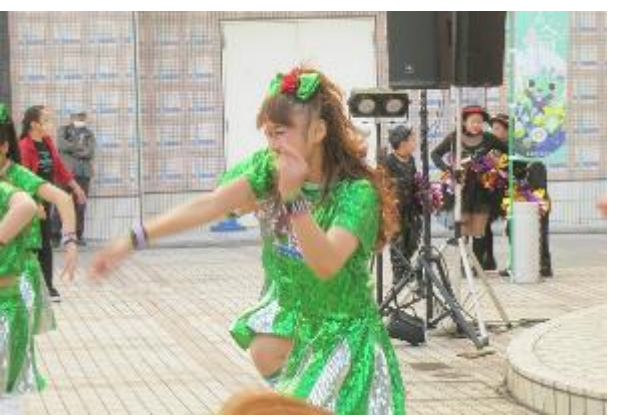
チャーリーダンススタジオ