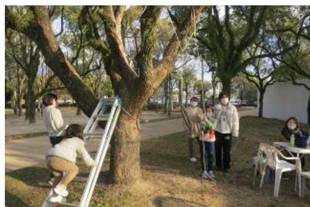
木登りエリア・・・ちょうど登りやすい樹が