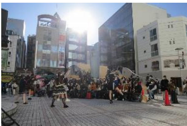
アイドルLIVE ①ガンジャバンギラス