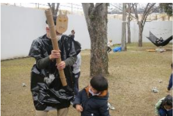
どこからか鬼が現れる・・・怖いと泣く子もいる