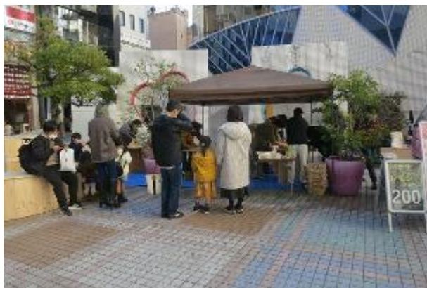
WSブース 広島県産材ヒノキ マイ箸作り