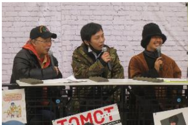
講評 (MCと先輩アーティスト)