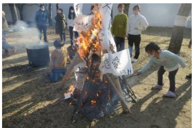
燃えろ、古い災いさらば! 希望よ天に届け!