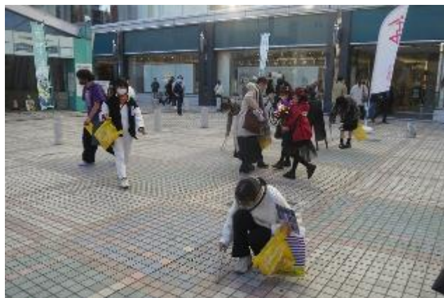
アリスガーデンマナーアップ クリーンアップ作戦②