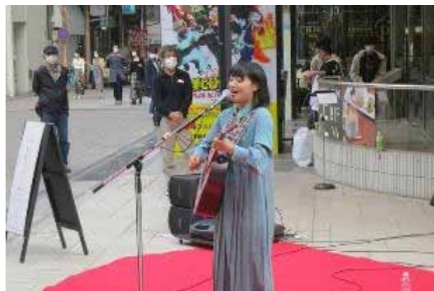
ライブ④ 16:00~16:30 toy

■舞台設営：赤パンチを床に敷き演奏スペースとする。「音街」オリジナル幟、プログラム看板を設置。