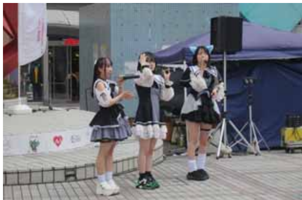
サークルクラッシャー