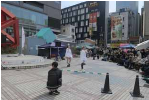
MELTY GHOST CLUB