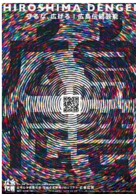
広島伝芸 HP URL QR コードポスター