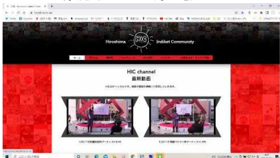
ホームページでの活動発信

*RCC ラジオ「AH! FUN! RADIO♪」毎週日曜 12:30～「HIC 企画」との連動