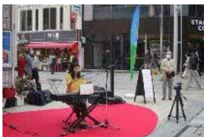
うずら「音楽ハ如何」