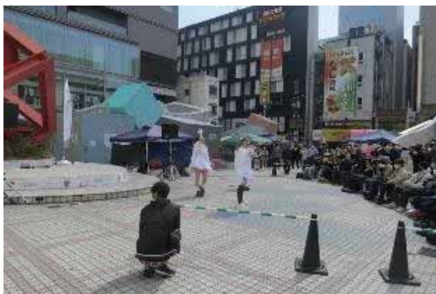
アリスガーデンパフォーマンス広場AH!

..... *令和3年度 区の魅力と活力向上推進事業補助金事業 伝える「技」と「心」～「広島伝芸」