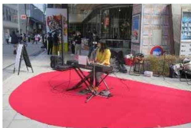
ライブ③ 15:00~15:30 うずら