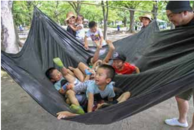
ハンモックお団子状態