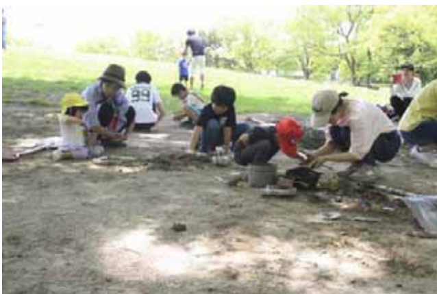
今日は泥んこマイワールドいっぱい