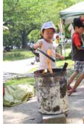
紙くずをそうっといれてみる