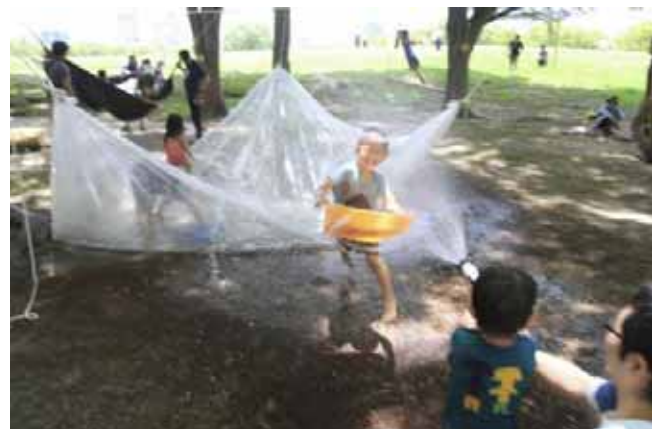
水遊び シャワ-VSてみ!