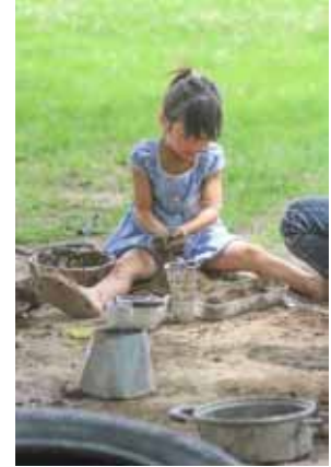
泥んこマイワールド