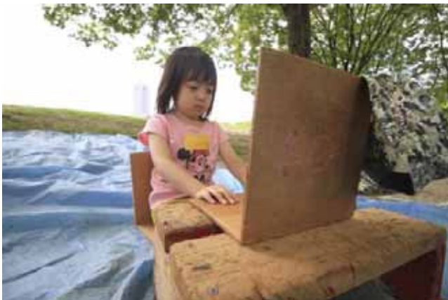
オフィスレディ発見!