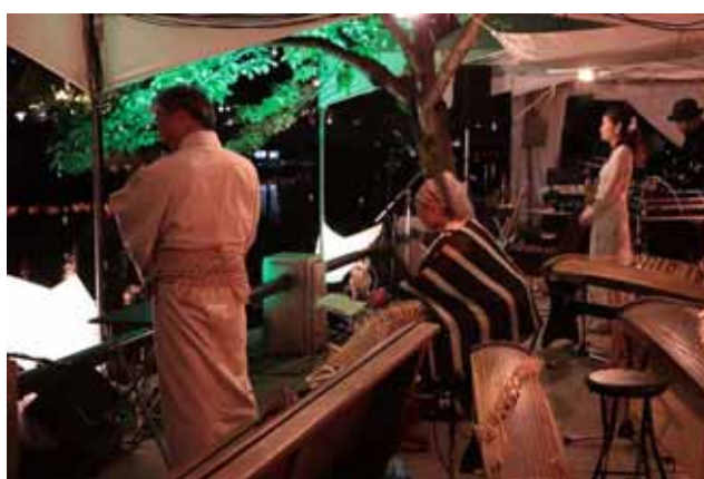
後半二部「煉獄のセッション」