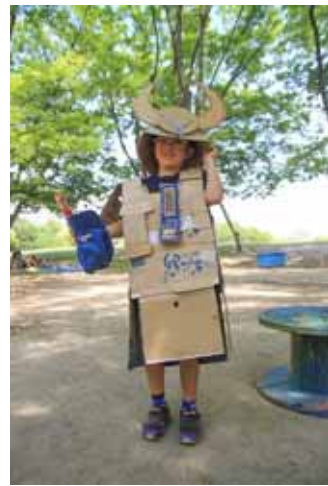
段ボールで兜に鎧！