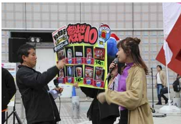
そしてドン・キホーテさんのコーナー。今回は月間売り上げベスト 10 の中から 1 位・2 位・3 位を当てるゲーム第 1 弾。