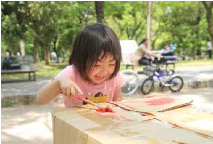
段ボールに赤色を筆でのせる。楽しそう