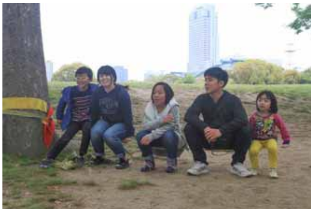
毎回、自遊ひろばに遊びに来る人たち