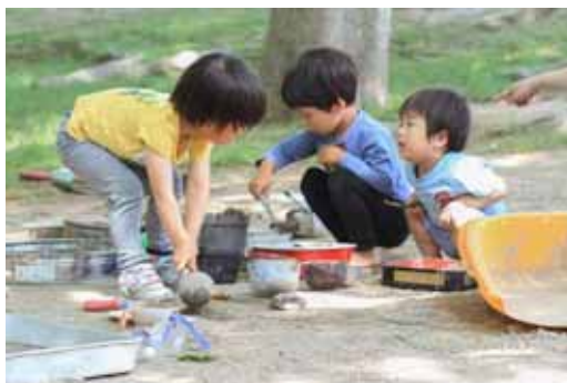
おにいちゃんたち、お玉がじょうず。