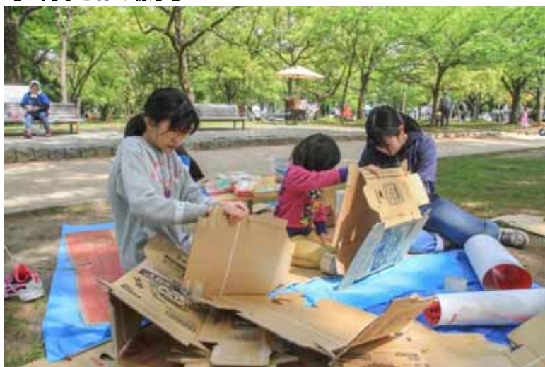
段ボールでなにやら作る・・・