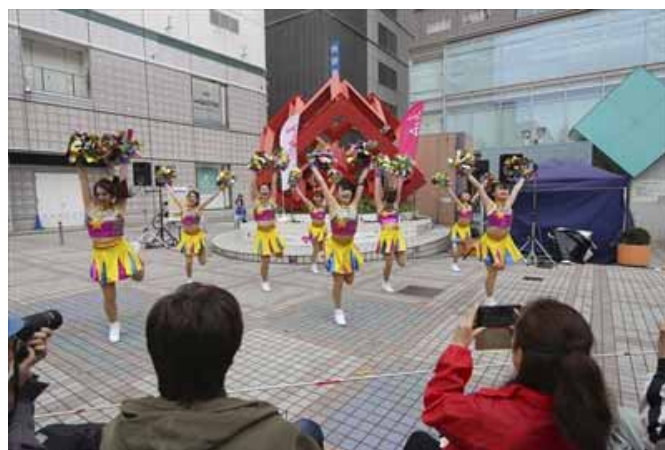
つづいてチャーリーダンススタジオのみなさん。