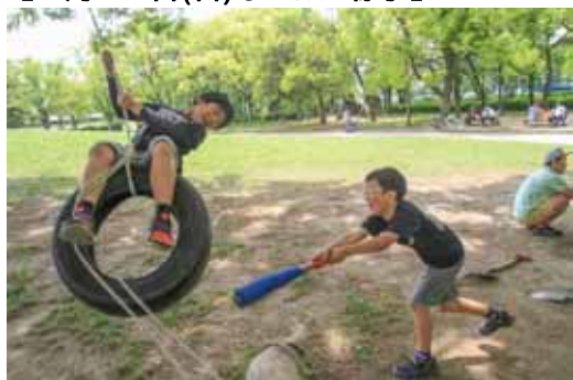
(バットで)あててみ〜 えいっ！