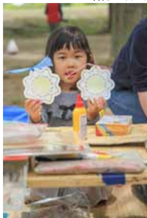
色違いのリボンをつけたよ