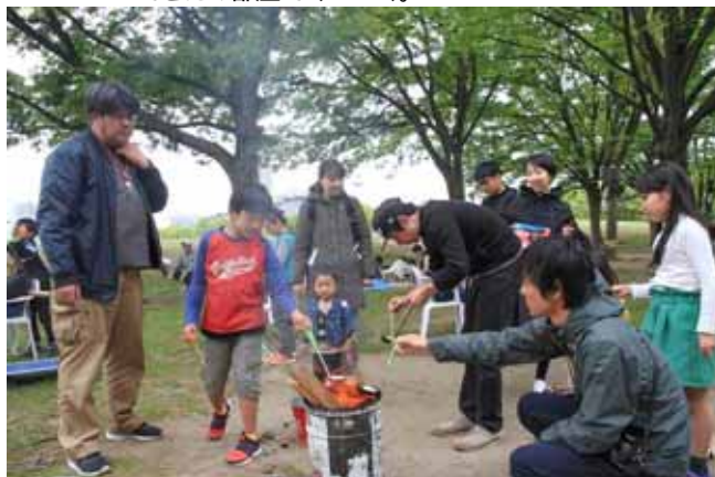
べっこう飴づくりにお父さんたちも挑戦!