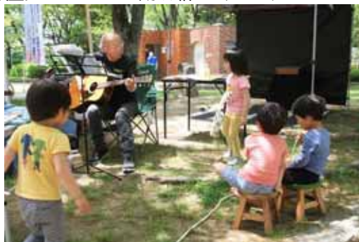
おじさんのギターリサイタル！