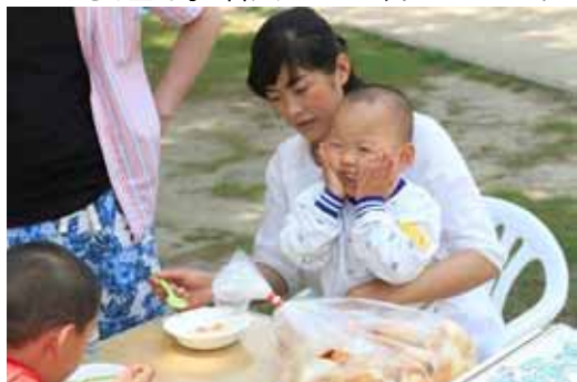
パンとシチュー 「ほっぺたおちちゃう」