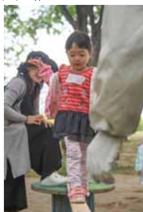
一本橋、そーっと渡る