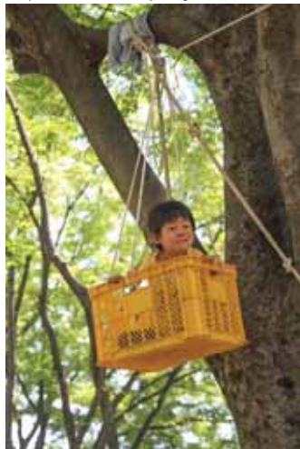
みかん箱のエレベーター