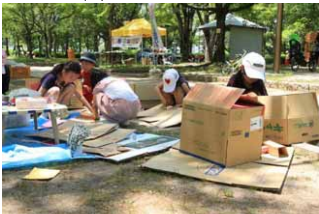
黙々と工作意欲にわくひろば