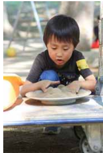
台車の上で。さらさらのサラ粉で。