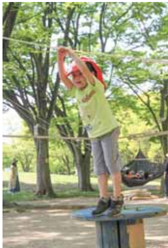
ロープで慎重に・・・