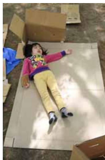
できたお部屋でくつろぐ。