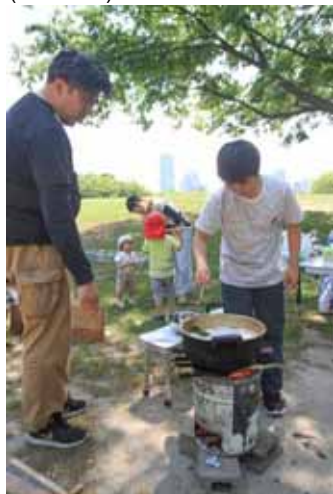
こっちもお玉で母の日シチューづくり