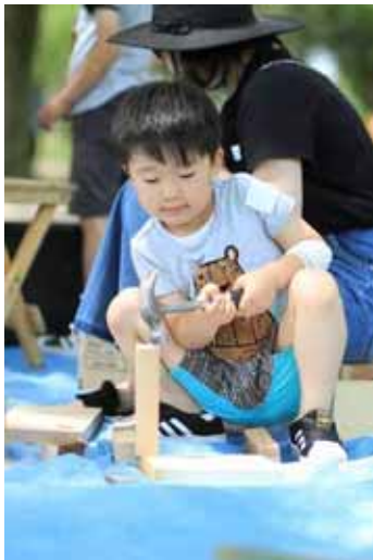
木切れを縦にして、集中！