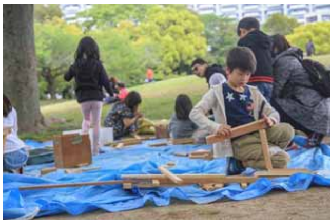
木工作。なが〜い何かを作っている！