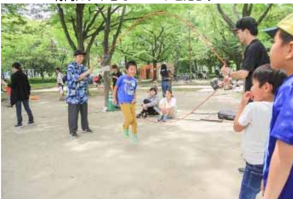
こどもおとなも LET'S ダブルダッチ!