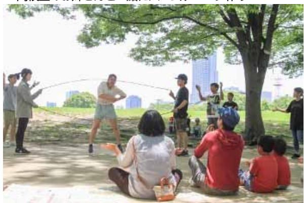
ダブルダッチのパフォーマンス 段ボールの観覧席!