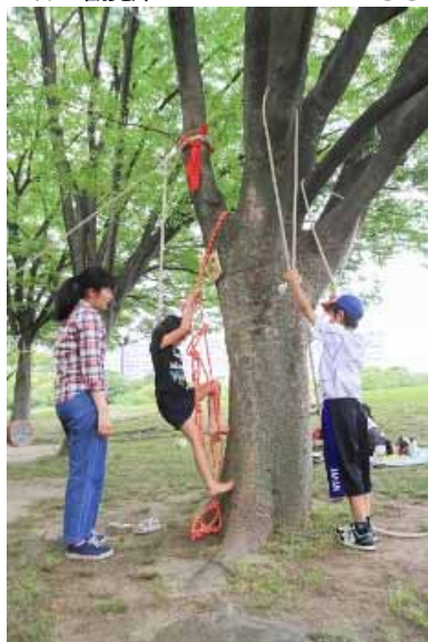
ロープを使ってコチラは木登り!