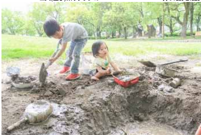
どろんこ遊び。だんだんダイナミックになっていく