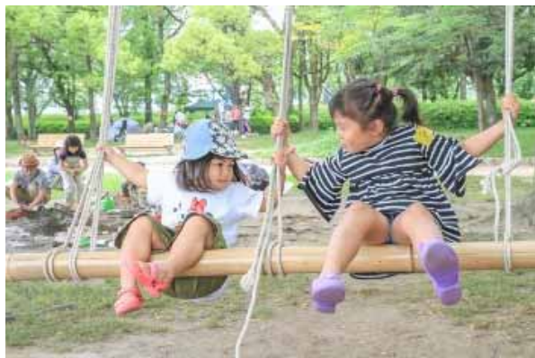
二人(並び)乗りブランコ