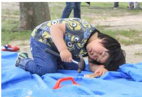
打った釘を確認する。あともうちょっとかなあ・・・