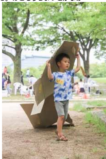
段ボールを運ぶ人