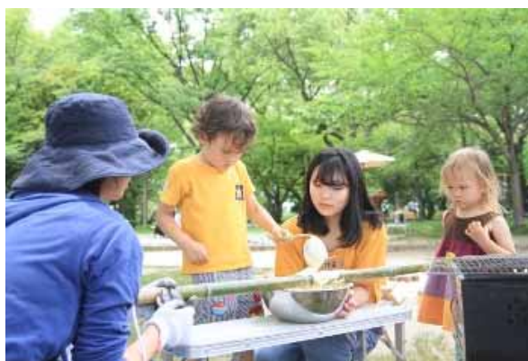
竹筒にタネをそ〜〜とたらす