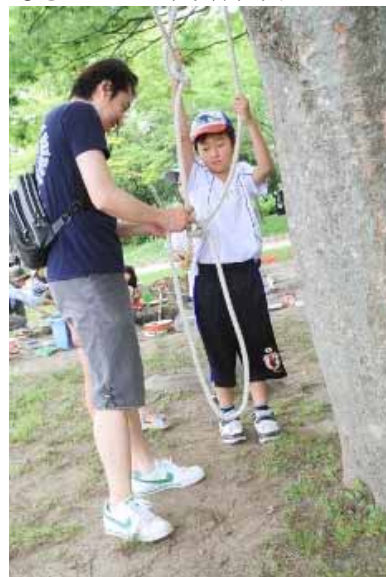
お父さんも童心にかえって縄ばしご