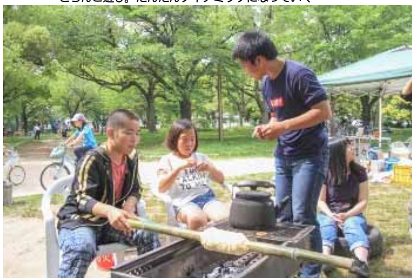
中3の料理長が見事なバームクーヘンを！