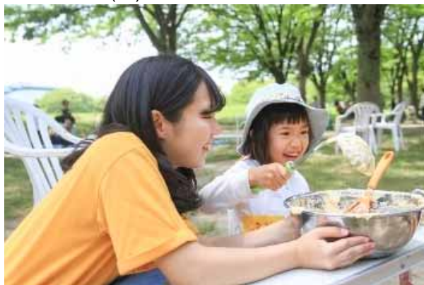
高校生のお姉さんと一緒にバームクーヘン作り