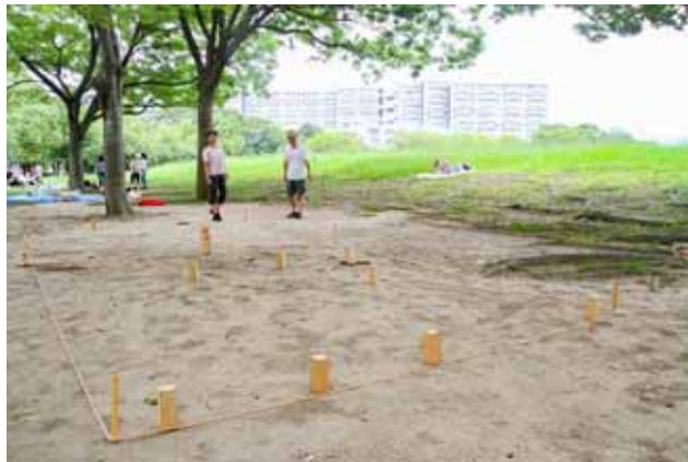
夏休みに入りボランティアの学生さんがたくさん！ パークゲーム「カップ」をもって遊びに来ていただきました