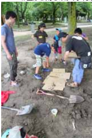
応急手当講習の裏で落とし穴作り