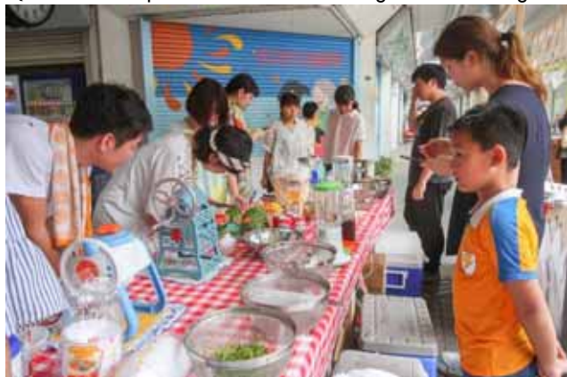
朝準備に大雨！一時避難し基町ショッピングセンターへ

( ブログ http://boukenasobiba.blog.fc2.com/blog-entry-210.html )