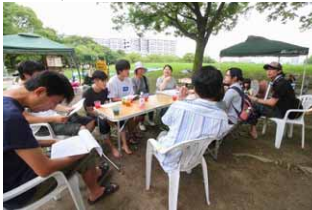
お昼から雨もあがり。応急手当講習中