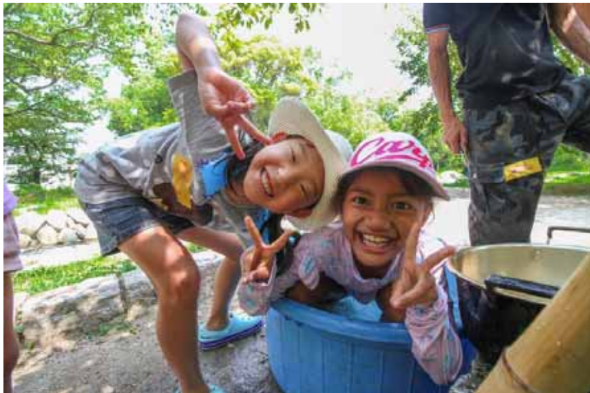
今日出会った女の子同士。そうめん流し、楽しかったね