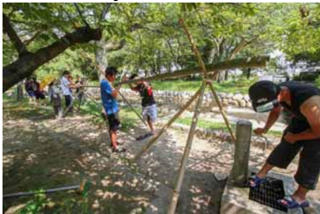
台を設置し、うまく流れてくれるか実験中!