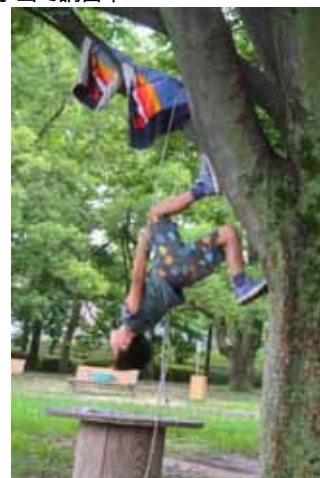
ロープを操る少年