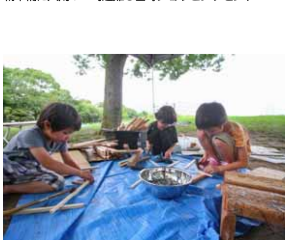
応急手当講習の隣では子どもらがトンカツテン