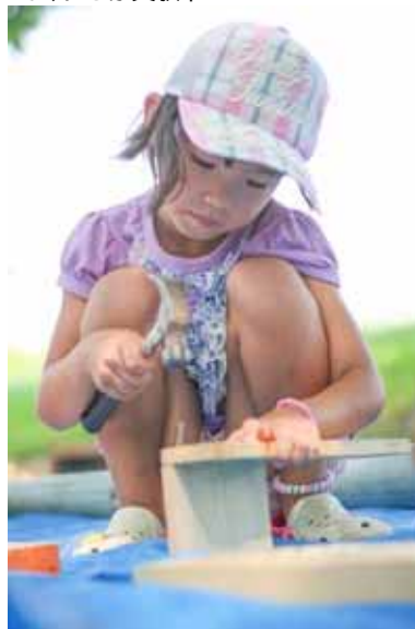
こちらも台を作っているのかな?