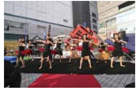
水着 collection (ムラサキスポーツさん、有限会社 PUPPY さん presents)