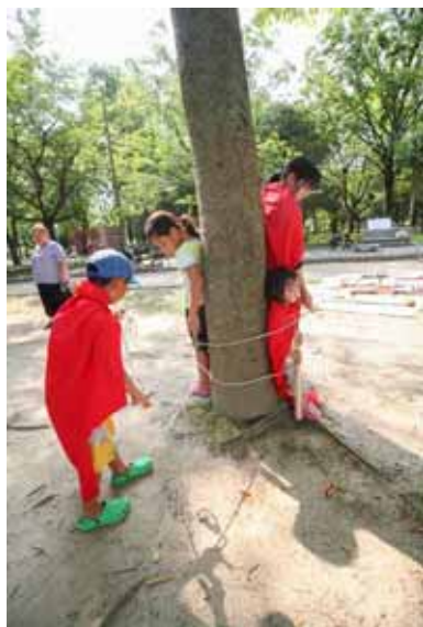
捕らわれた?!助けて~マントマン!