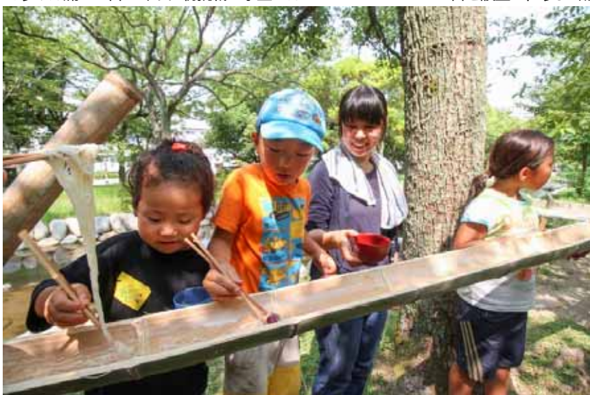
そうめんの後からゼリーが流れてきた! うまくつかめるかしら?