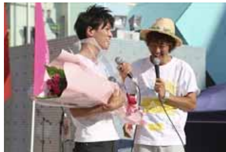
手紙屋くまさん"大書パフォーマンス" 今回はソーランとのコラボレーション