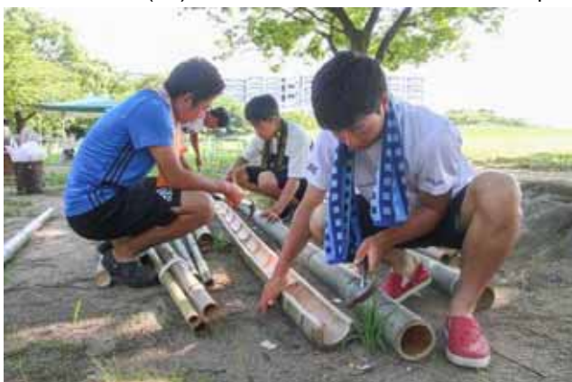
そうめん流しの台づくりに初挑戦の学生さん

【8月20日(日)ひろばの様子】自遊ムービー https://1drv.ms/v/s!A18mMgbE1IPwhoRU7oV4huzAkh451A