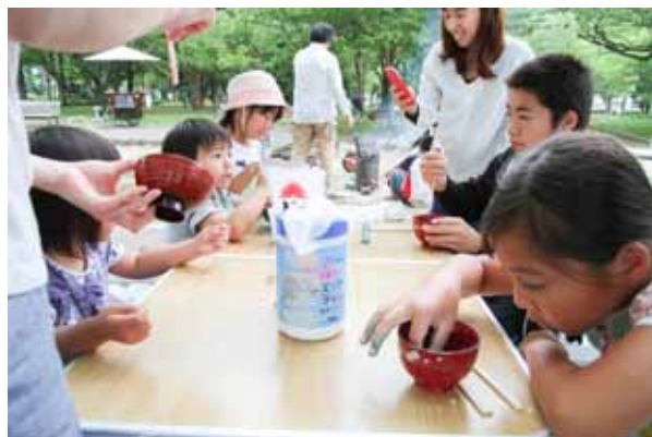
食事風景ではありません(^^;)片栗粉でスライムづくり