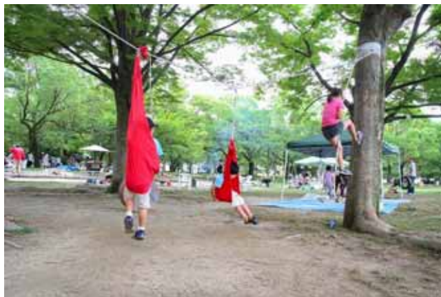
布ブランコに揺れながら木に登る人を見る