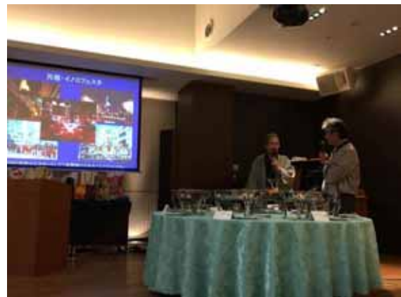
セトラひろしま15年の歩みご紹介など

この度、平成29年度「第6回まちづくり法人国土交通大臣表彰(まちの活性化・魅力創出部門)」をいただき光栄と思いをととも感謝申し上げます。