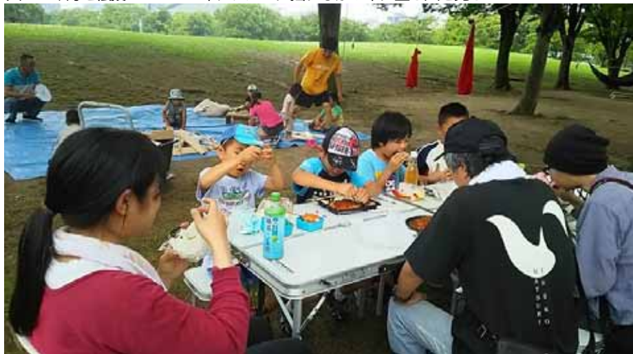
「自遊食堂」になるひろば