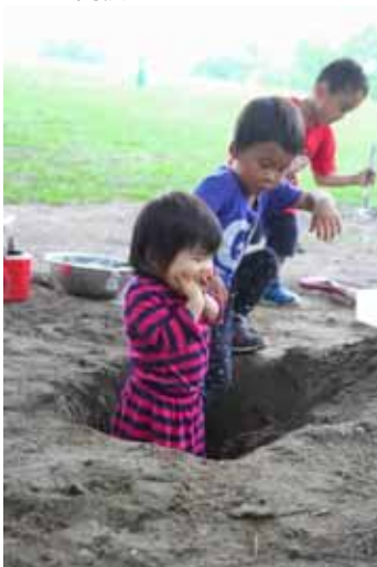
「穴に落ちこちゃった!」