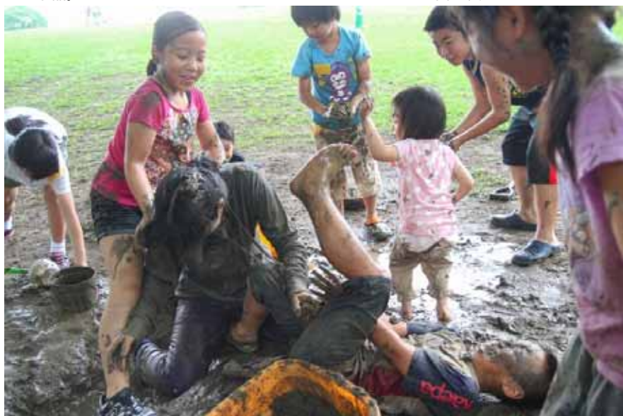
雨上がりのどろんこ