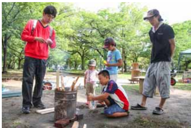
常連の子どもがボランティアの学生に火のつけ方を伝授