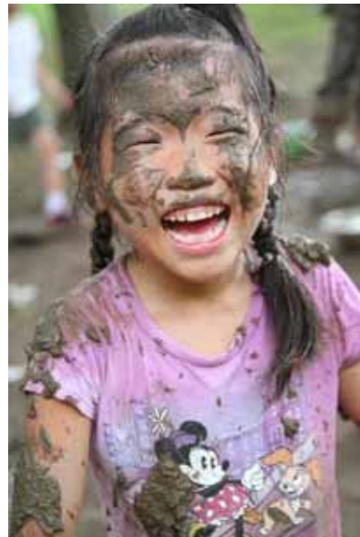
「次はゾンビごっこしよ〜！」