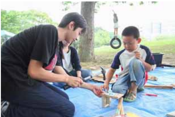
高校生ボランティアのお兄ちゃんとう木工作

(ブログ http://boukenasobiba.blog.fc2.com/blog-entry-207.html )