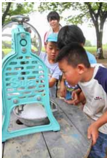
かき氷器。じっとみている