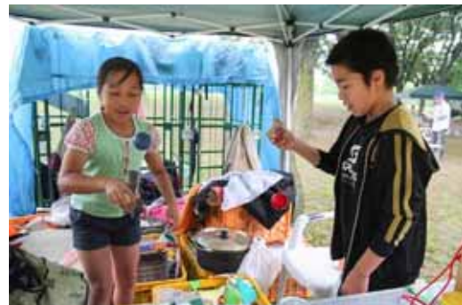
雨が降ってきてテントに一時避難。そしてアソブ。