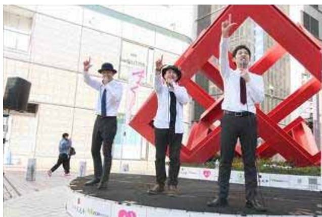
BAMPさんは、アニメソングや歌いながらのバルーンアート！！(下左)