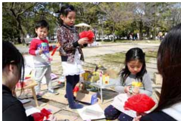
大学生のお姉さんからのお花紙が流行中！