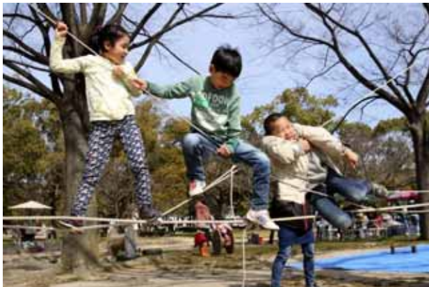
なんとか3人乗り・・・