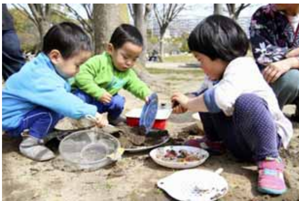
大ご馳走！それぞれによそったりにぎったり。