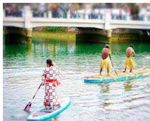
夕方、妖怪たちが川から現れる！