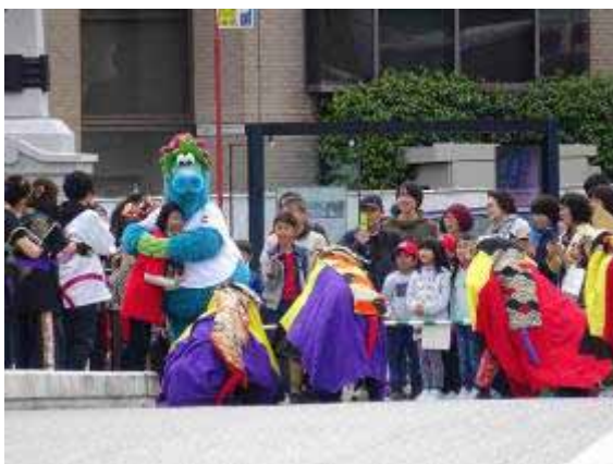
スライリーとカーブ優勝祈願渡り