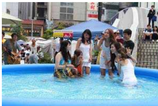
H00 宣伝イベント実施 (7月16日・アリスガーデン)