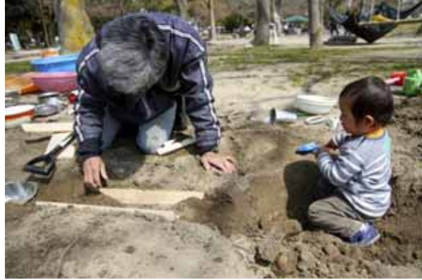
ロープワークを教える先輩大学生と教わる大学生と子ども おじさんが水路作りに遊んでいるのをじっと見ている