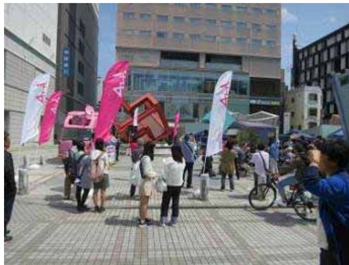
新しいイベントガイドブック と 新しいのぼり