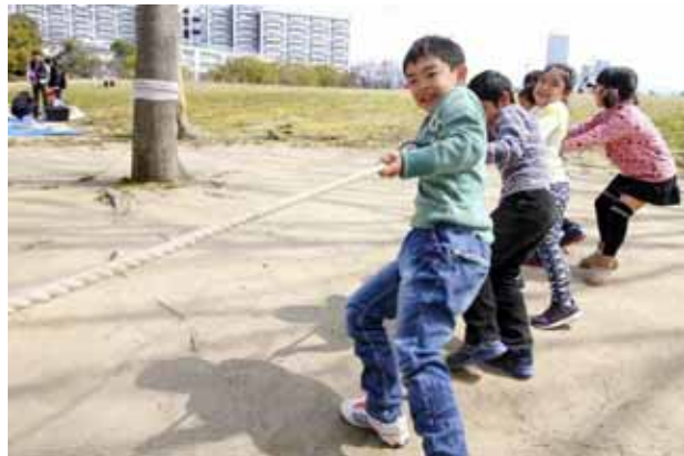
6人で引っ張る。相手は誰かな？