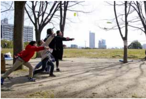
朝一番！紙飛行機大会、開催中。