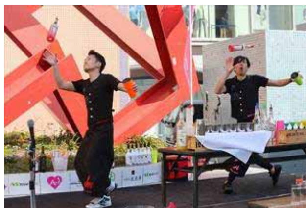
そして、ちょうど、First Chance の途中、午後2時46分 みんなで黙祷を捧げました latino mixさんは、カクテルパフォーマンス。(上右) こどもたちには、ジュースのカクテルも！