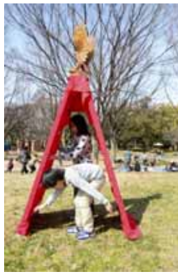
大人がワシをまつた後に・・・ なんとか3人乗り