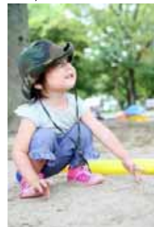
さらさら気持ちがいいね