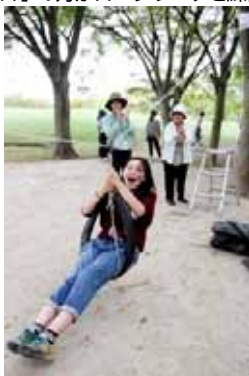
ロープワーク 滑車~大学生のお姉さんも