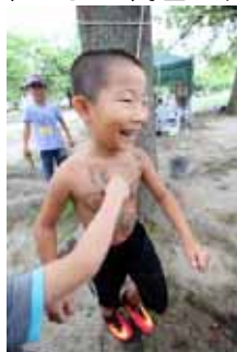
お腹に落書き・・・