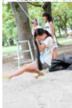
~中学生のお姉ちゃんも