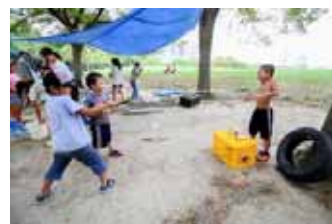
的ですから!安心して下さい!!