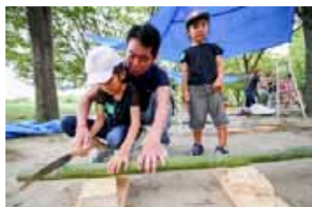
お父さんと一緒にその頃