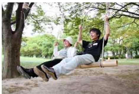
ロープワーク 竹ブランコ~完成の喜びに