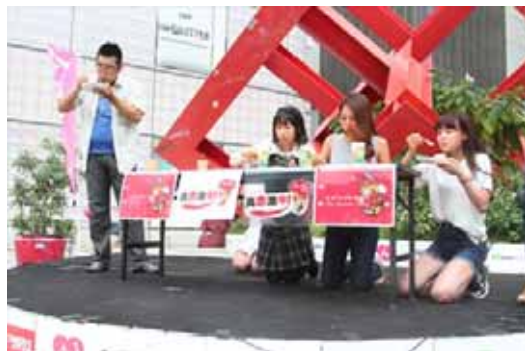
そしてもちろんコーナースポンサーであるスズメバチカレーさんのカレー早食い対決！

Dance Dance Dance Battle, 今回は、ジャッジのHeroさんのダンスショーから