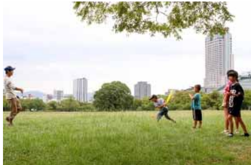
その頃、芝生で草野球・・・