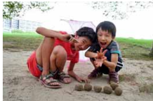
ひろばの片付け跡で、お団子作り