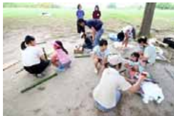
竹で水鉄砲をつくる