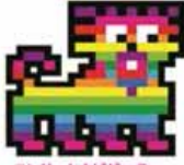
コンサートナビゲーター 「イキモノ」

このコンサートでは、音楽で伝える平和とは何か、橋を架けて未来に渡したいもの、平和へと導く大切なもの、それは人類が共通して持っている感覚「生への喜び」だと考え、このコンサートを通じて「生への喜び」を会場の皆さんに共有していただくために、様々な仕掛けや物語をご用意しています。そのキーワードとなるのがデジタルキャラクター「イキモノ」。「イキモノ」は、コンサートナビゲーターであり、会場内の様々な場面で発信される映像の中で生きています。会場の皆さんと一緒に「イキモノ」を育てることで、このコンサートと一緒につくりあげ、平和について考えたいと思います。