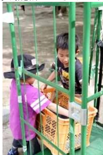
何やら企む兄弟・・・(-_-メ)