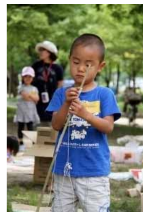
川へ釣りにいってきます