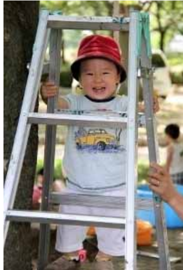
今日はボクちゃんここまでにしとこ