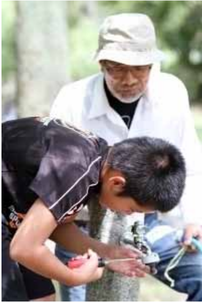
ひげじいちゃんに見守られ蛇口を準備