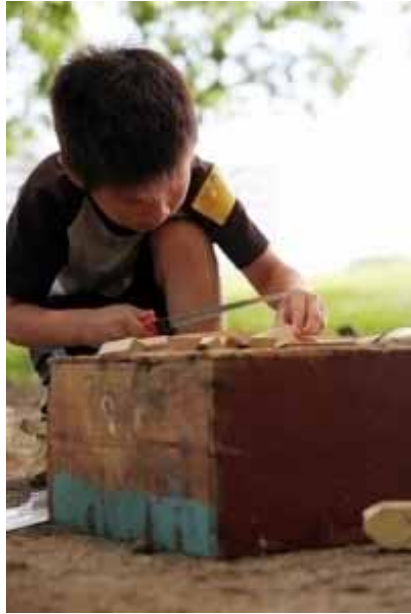
こちらは一人で黙々と・・・