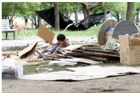
なんか丁度ええもんないかいな・・・