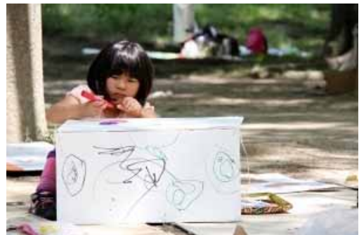
な～んでもキャンパスになっちゃうも～ん