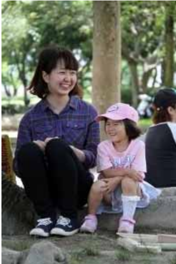
2人っきりの、えへへへ