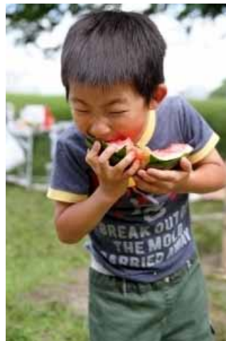
やっぱりこれだね!! ~夏の風物詩~