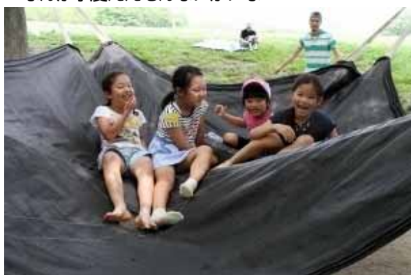
体と体が触れ合って 自然と笑い声が重なって