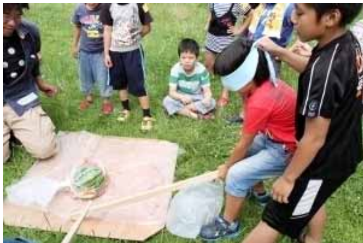
夏といえば・・・スイカ割り～!!