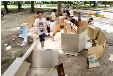
渦巻く迷路?! 結末はいかに!!