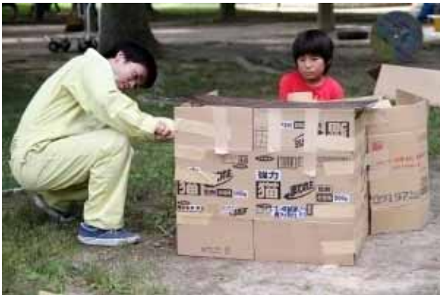
燻製装置を作ってるつなぎの兄ちゃんを見ている少年