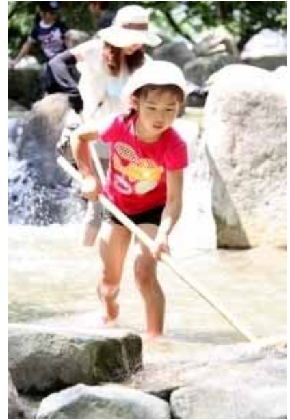
遊びのような？労働のような？