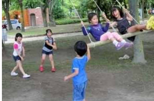
いくよ～！おっけ～！きゃ～！・・・いろんな声