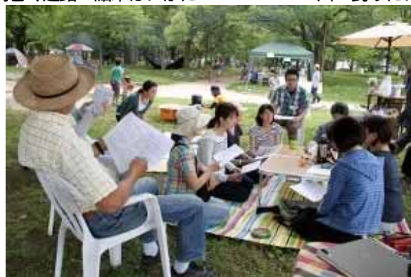
ひろばで学ぶ救急法～こどものケガの対応と心の備えに～