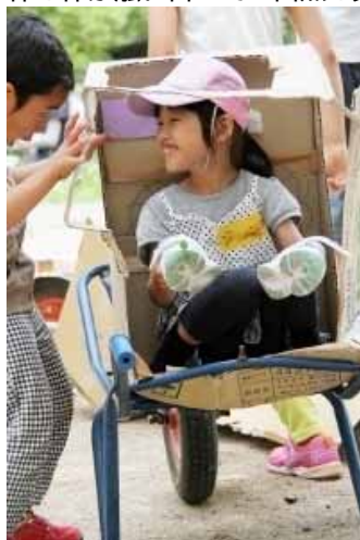
素敵な天窗のある押し車