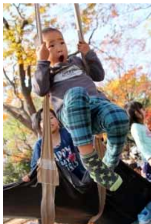
瞬間空中ブランコ?!