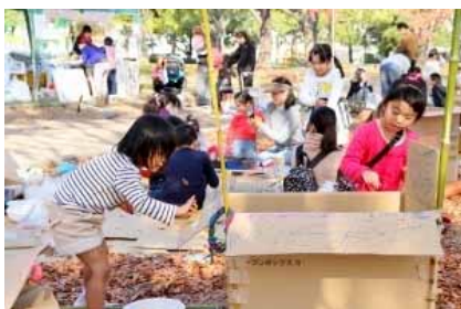
素敵なおうちに飾り付け♡