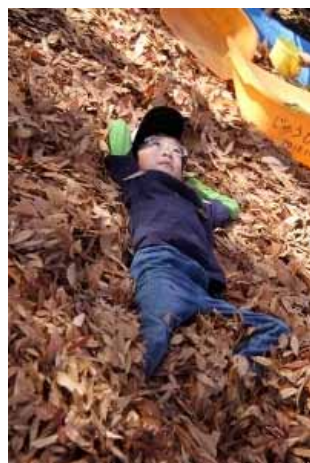
物思いにふける少年よ