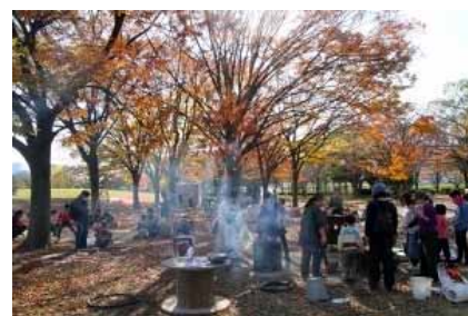
美味しい!? 煙たち登る自遊ひろば