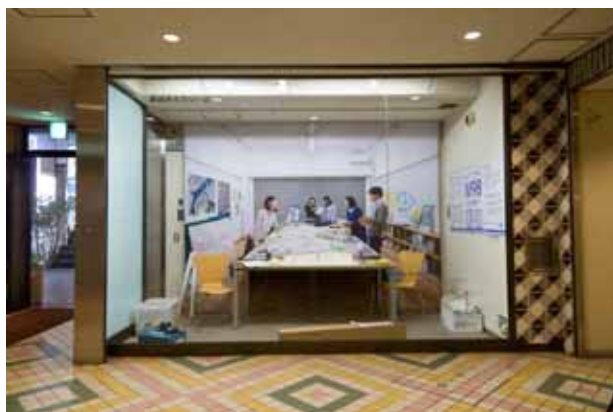
流川「新地ギャラリー」