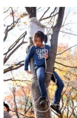
ロープをつたって