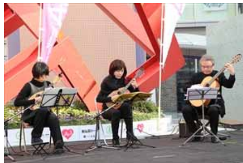
アンサンブルチアロのみなさん