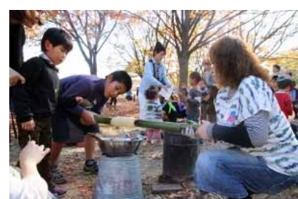
只今バームクーヘン育成中