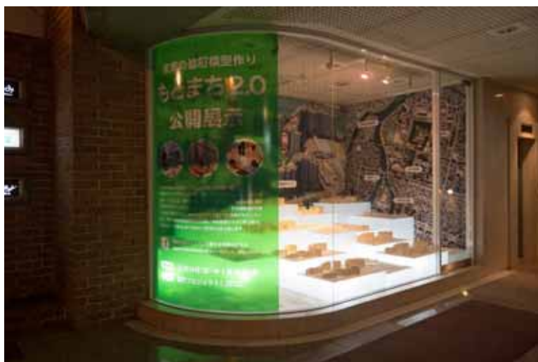
流川「新地ギャラリー」

平成25年7月に広島市が地元住民と連携しながら策定した「基町住宅地区活性化計画」に掲げている「基町アートロード、アートによる魅力づくり」を、広島市立大学芸術学部と中区役所が連携して、平成26度から取り組んでいる。この取組は、創造的な文化芸術活動や地域交流を通じて、まちの魅力づくりや、基町住宅地区の活性化を目的とするもの。今回の展示は、この活動のことを紹介しています。