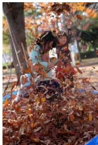
葉っぱのシャワー!!