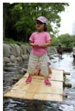
いかだに乗る女の子