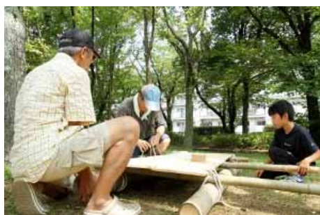
いかだをつくるじいちゃんと孫