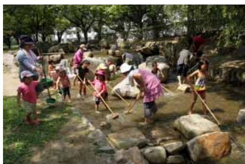
デッキブラシで川掃除のような川遊び?!