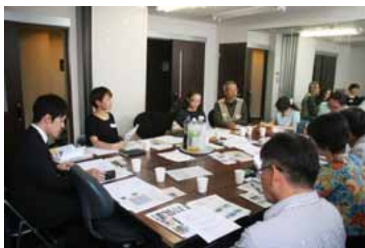
6/15「冒険遊び場事業意見交換会」