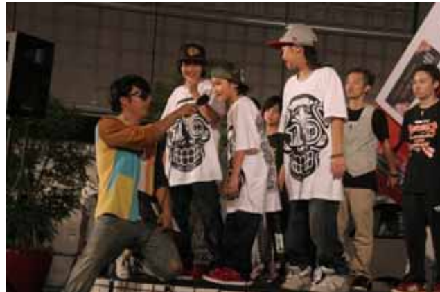
優勝は、Onself crew。3度目、強いです！！（図・上右）