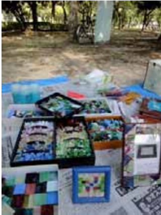
ガラスモザイクづくり