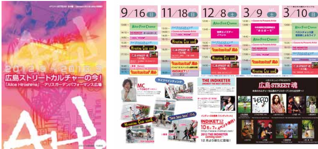
《2012年下期のAH! イベント・ガイドブック》好評配布中！

2012年下期のイベント・ガイドブックを作成しました。AH! より多彩で充実した内容となっております。協賛企業の各位に感謝申し上げます。