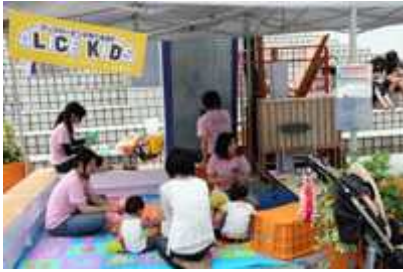
ALICE KIDSの「遊んでいきんちゃいコーナー」です。