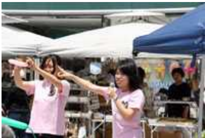
広島文教女子大学パピママ応援団「ぶんこ」の皆さんによるバルーンアートかわいいネズミができあがりました。