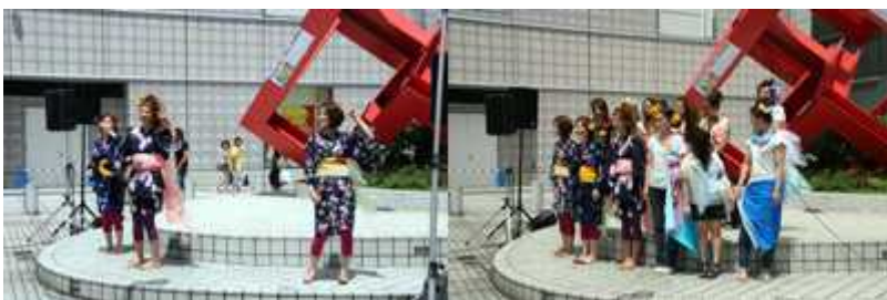
穴吹デザイン専門学校ビューティープロ学科さんによるファッションショー 学生さんによるとてもきれいなファッションショーでした。