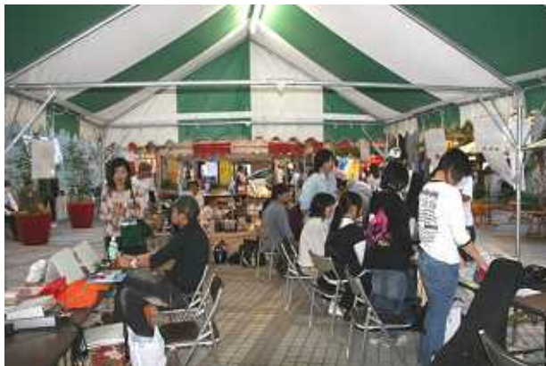
* 今年の INDIKET の様子