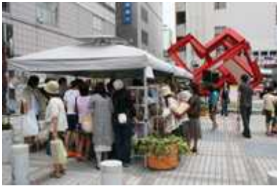
ママさん作家さんによるハンドメイド雑貨コーナーです。 zakkaD'sさん、帽子屋さん、stitch2houseさん、kakeraさんが出店してくださいました。 happy*cloverによる体にやさしいおやつの販売もありました。