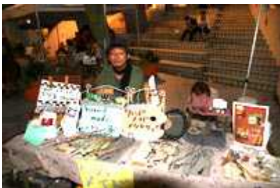
インディケットではおなじみのfrom 70's keyさん、AH!へは初参加です。