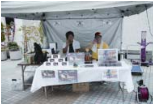
「本通セレクション」(ゴジラフィギュア!)