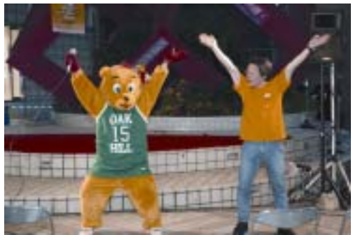
ブーティとみんなで踊ろう