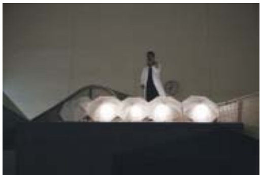
マドカ show 実行委員会