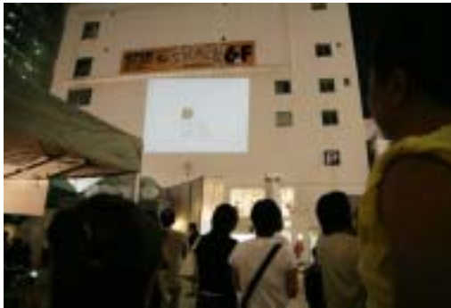
“アリスガ de アニメナイト”