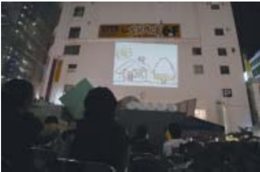
“アリスガ de アニメナイト”