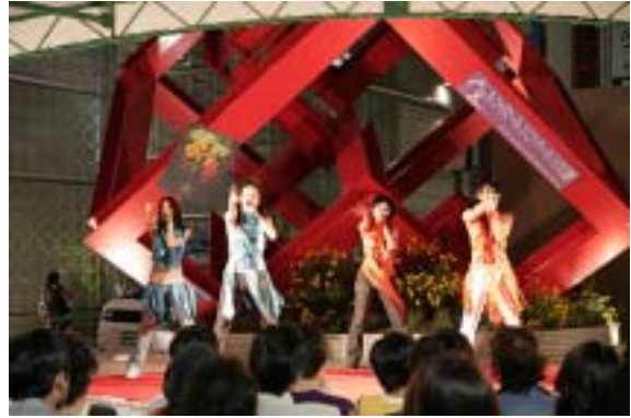
“Will Be Stars”